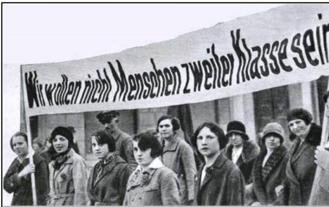
Frauen-Demonstration in den 1960er Jahren in der BRD.

Von staatlicher Seite aus erfolgte bereits ab der Gründung der DDR 1949 die Förderung und Unterstützung dieses Gleichstellungs-Prozesses. Eine Vielzahl von Staats- und Ministerratsbeschlüssen zur Förderung der Frauen und der Familie, bis hin zur Schaffung von Kinderbetreuungsmöglichkeiten, wurde auf den Weg gebracht. Heute bereits wieder ein Novum, damals Selbstverständlichkeit, um Arbeits- und Qualifizierungsmöglichkeiten sowie Schichtarbeit abzusichern. Ab Mitte der 1950er Jahre wurde verstärkt die Umsetzung des Rechts auf Bildung in den Fokus der Frauenförderung gestellt. Berufsausbildung wurde selbstverständlich, Möglichkeiten eines kostenfreien Studiums für jeden, ob an Arbeiter- und Bauern-Fakultäten („ABF“, s.a. MDR 26.2.2019/ 21 Uhr „der Osten“), als Fern- und Abendstudium, Frauensonderstudium oder Qualifizierung in Frauenakademien. Für die Teilnahme an Qualifizierungen wurde in den Betrieben regelrecht geworben.