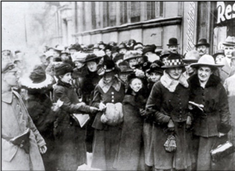
19. Januar 1919: Wegen der hohen Wahlbeteiligung mussten Wähler z.T. stundenlang vor den Wahllokalen anstehen.

gewesen. Und sie nahmen ihre Rechte wahr - die Schlangen vor den Wahllokalen waren 100 Meter und mehr lang, die Wähler mussten zumeist mehrere Stunden warten, bis sie an die Reihe kamen. Die Zeitungen berichteten: „ Erstmals sitzt am Wahltisch als Beisitzer eine Frau - die hätte dort früher nichts zu suchen gehabt - und dann sind unter den Wählenden mehr als die Hälfte als weiblichen Geschlechts zu bezeichnen “. Über 80% der Frauen gingen wählen. Ein Wendepunkt