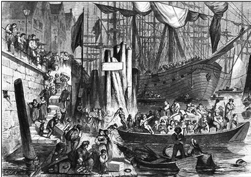
Aufbruch zur Auswanderung. Stich von A. Horn 1865

Überquerung, kurz vor der Bucht von New Orleans, wurde der Geistliche Martin Stephan von seinen Pastoren zum Bischof erhoben. Alle mussten eine absolute Verpflichtungs- und Unterwerfungserklärung unterschreiben.