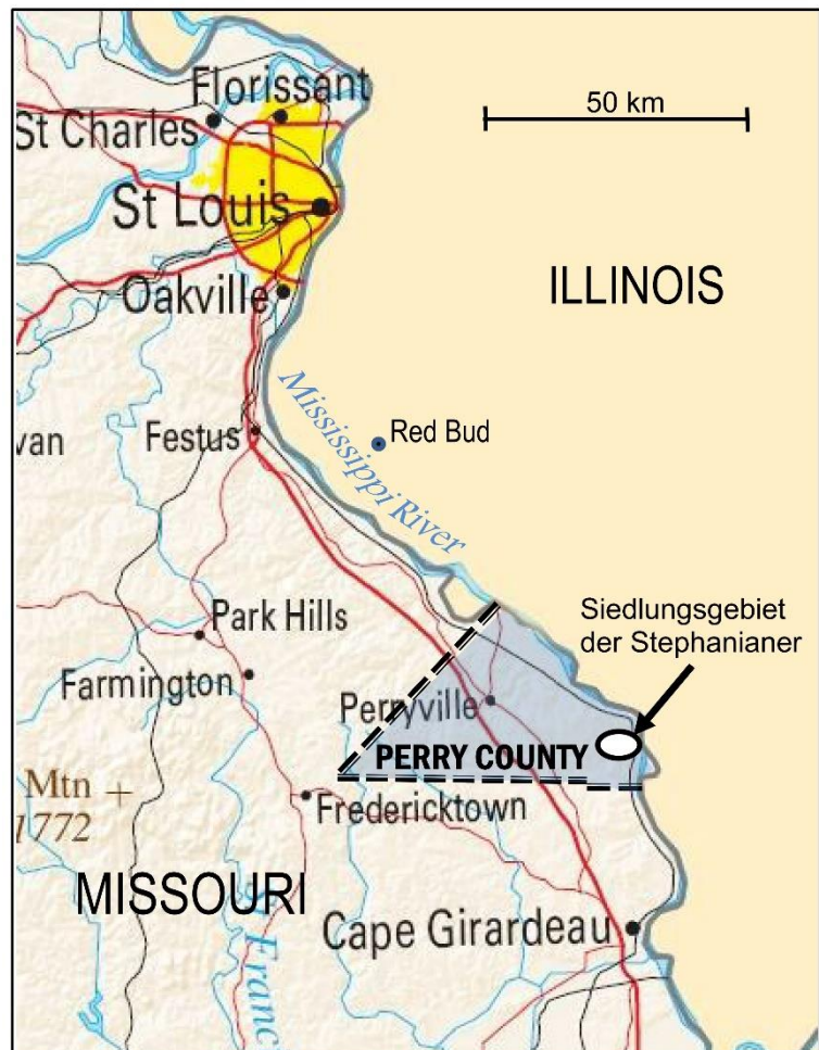
Das Siedlungsgebiet der Stephanianer in Perry County.