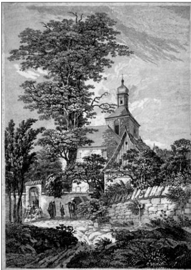
Die alte Kirche und die Linde in Wachau bei Radeberg Kupferstich von J. A. Darnstedt, um 1790