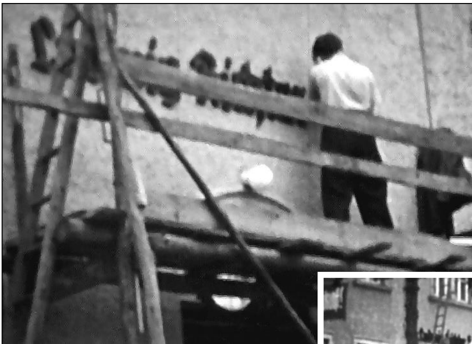
Anlässlich des 75-jährigen Schul-Jubiläums 1959 wurde die heute noch vorhandene Beschriftung angebracht.